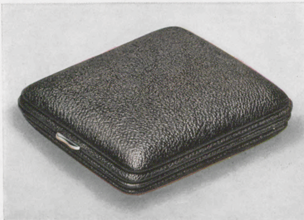
8 x 9 cm

Facetteglas, zweifarbiges Metallblatt mit Goldrelief- zahlen, Radiumpunkte und -zeiger