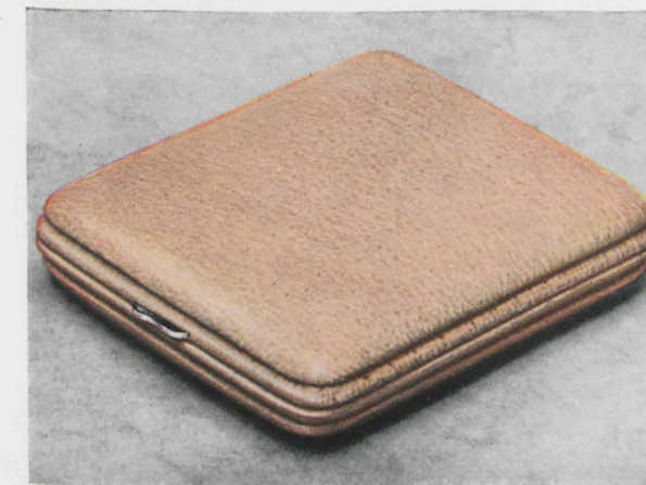
8 x 9 cm