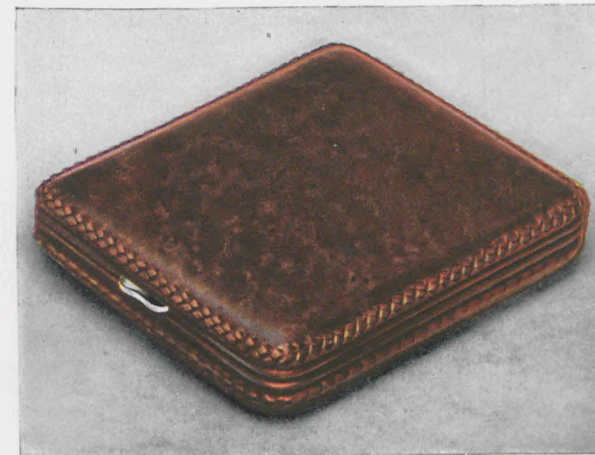
8 x 9 cm