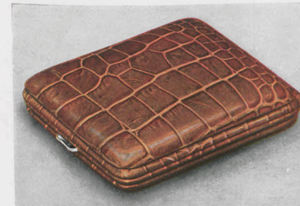
8 x 9 cm