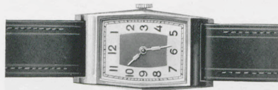
91/501 Dublee, Goldauflage 20 Mikron. Gehäuse 10 Jahre Garantie. Goldblatt mit Goldreliefzahlen. Unzerbrechliches Glas