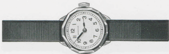
80/211 Silberblatt mit blauen Reliefzahlen