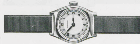
81/206 Silberblatt mit gedruckten, schwarzen Zahlen. Stahlboden