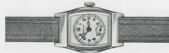
81/208 RP Silberblatt mit blauen Reliefzahlen, Radiumpunkte und -zeiger, Stahlboden. Unzerbrechliches Glas. Naturfarbiges Schweinslederband