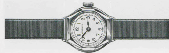
81/205 Silberblatt mit blauen Reliefzahlen. Stahlboden