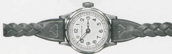
80/212 RP Silberblatt mit blauen Reliefzahlen, Radiumpunkte und -zeiger. Buntes Lederband