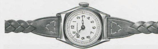
81/207 RP Silberblatt mit blauen Reliefzahlen, Radiumpunkte und -zeiger. Stahlboden. Buntes Kordel-Lederband