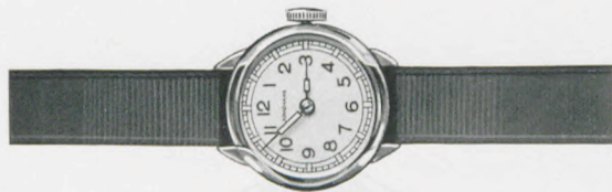
80/208 RP Silberblatt mit blauen Reliefzahlen, Radiumpunkte und -zeiger