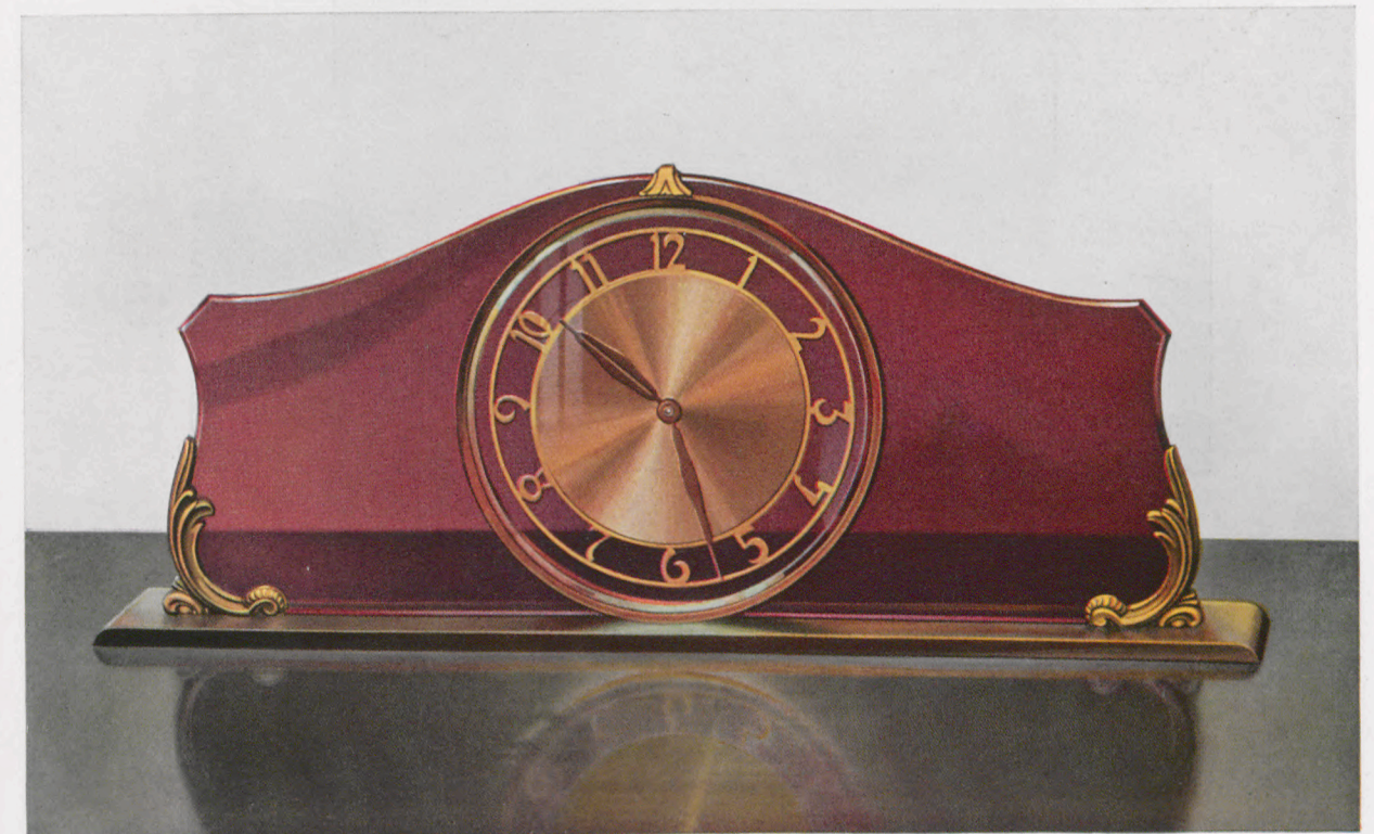
12 x 29 cm

Brüniert und vergoldet, mit durchsichtigem, kupferfarbigem Kristallglas Zeiger unter Glas, 8 Tag Ankergehwerk Nr. J 44, 7 Steine Ladenpreis . . . . . RM. 70.—