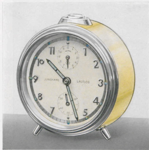
8/554 RP 10,5 cm