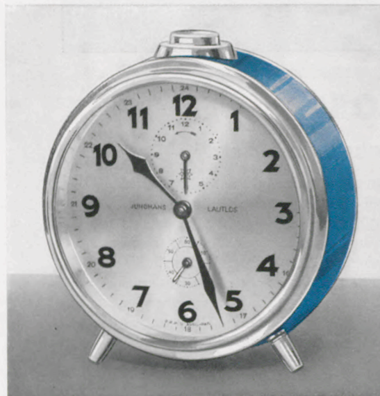
8/300 12,5 cm

Ladenpreis mit RP ..... RM. 13.— 1 Tag „Lautlos“-Weckerwerk Nr. 10 G, Schlag auf Innenglocke