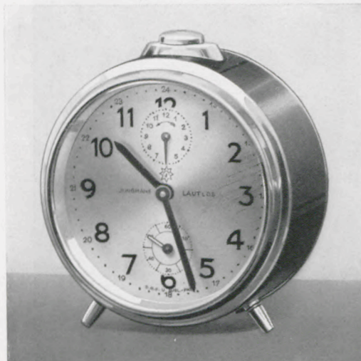
8/556 10,5 cm

Ladenpreis mit RZ ..... RM. 12.— 1 Tag „Lautlos“-Weckerwerk Nr. 231 G, Schlag auf Rückwand, mit Vorabsteller