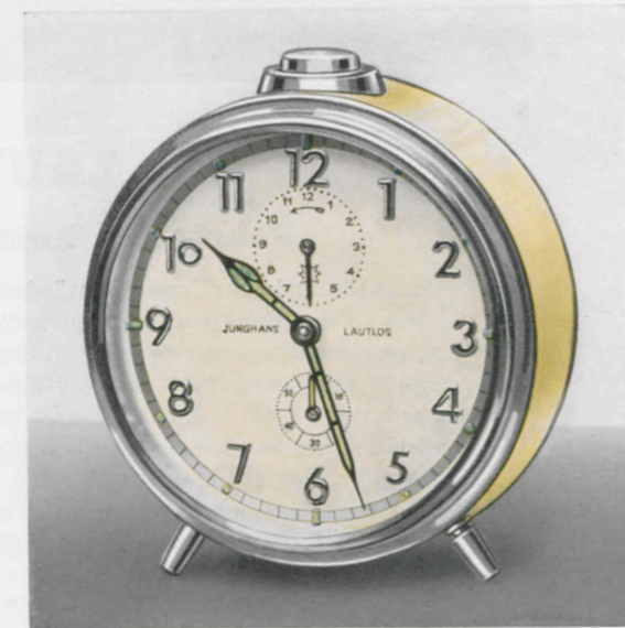
8/558 RP 12,5 cm