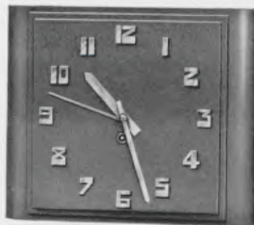
25 x 30 cm = 9 7/8 x 12 inches