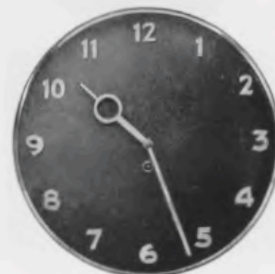
30 cm = 11 3/4 inches

Mat-silvered figures, strokes and hands Chiffres, barres et aiguilles argentés, mat Cifras, rayas y agujas plateadas, mate