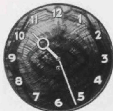
30 cm = 11 3/4 inches

Junghans Synchronous-Movement for controlled alternating-current of 90-260 volts Mouvement Synchron Junghans pour courant alternatif contrôlé de 90 à 260 volts Máquina Sincron Junghans para corriente alternativa controlada de 90 à 260 voltios