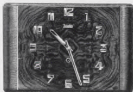
22x34 cm = 8 7/8 x 13 1/2 inches