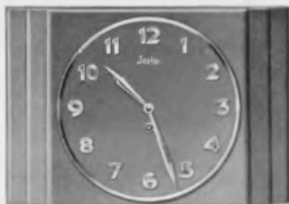
22x33 cm = 8 1/2 x 13 inches

Chromium plated figures and hands Chiffres et aiguilles chromés Cifras y agujas cromadas