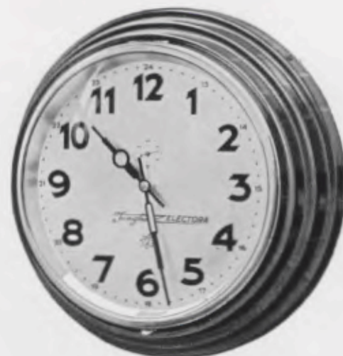
33 cm = 13 inches