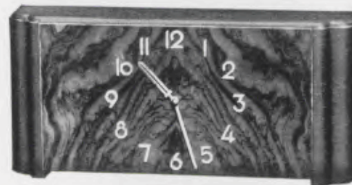
14×32 cm = 5½×12½ inches