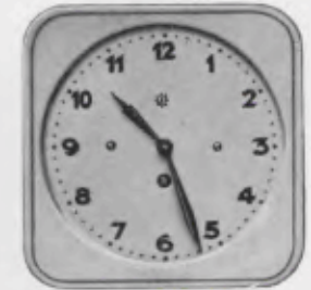
20x20 cm = 8x8 inches