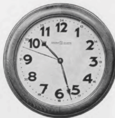
31,5 cm = 12 1/2 inches

Elfenbeinfarbig Varnished ivory dull Peinture ivoire lacquée dépolie Barniz pulido mate marfil Verchromte Zahlen und Zeiger Chromium plated figures and hands Chiffres et aiguilles chromés Cifras y agujas cromadas