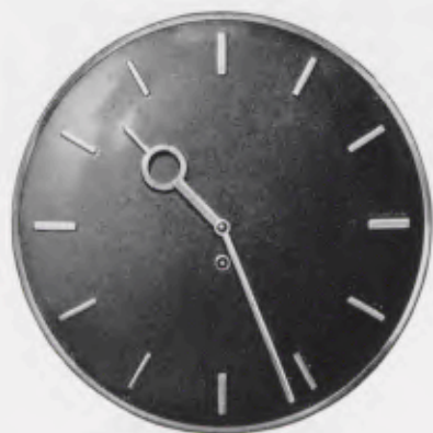
30 cm = 11 3 / 4 inches