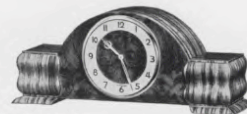
12×30 cm = 4 3 / 4 ×11 3 / 4 inches

Chromium plated bezel, silvered figure-circle Lunette chromée, cercle à chiffres argenté Bisel cromado, cerco con cifras plateado