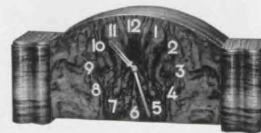
14×32 cm = 5½×12½ inches

Chromium plated figures and hands Chiffres et aiguilles chromés Cifras y agujas cromadas