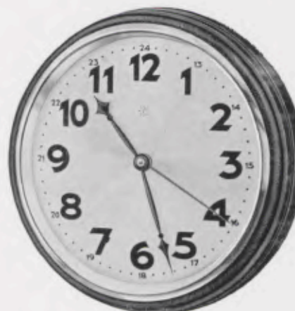
34,5 cm = 13 1 / 2 inches

Black figures, strokes and hands Chiffres, barres et aiguilles noirs Cifras, rayas y agujas negras