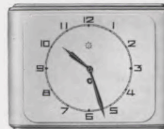
20x26 cm = 8x10 1/4 inches