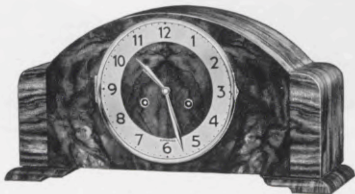
21 x 42 cm = 8 1/4 x 16 1/2 inches