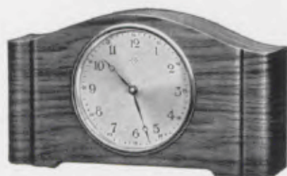
12,5×23 cm = 5×9 inches

Chromium plated bezel, silver dial Lunette chromée, cadran argenté Bisel cromado, esfera plateada