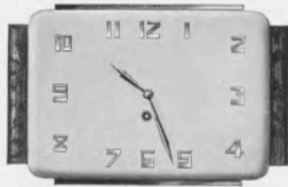
20x31,5 cm = 8x12 1/4 inches