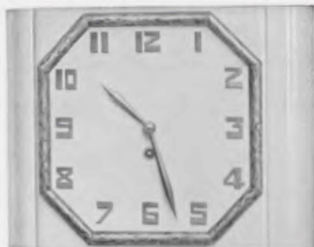
22x29 cm = 8 1/2 x 11 1/2 inches