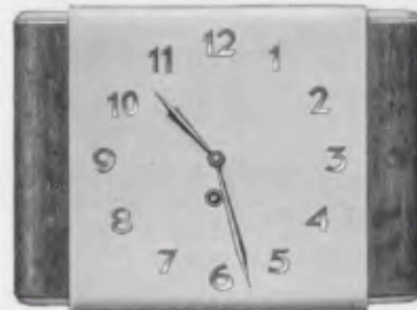
21x29 cm = 8 1/4 x 11 1/4 inches

Chromium plated figures and hands Chiffres et aiguilles chromés Cifras y agujas cromadas