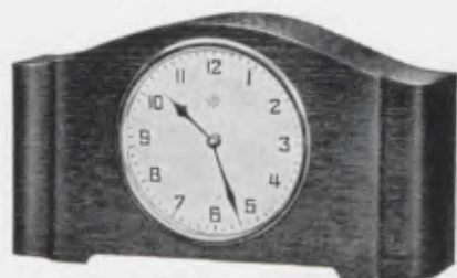
12,5×23 cm = 5×9 inches