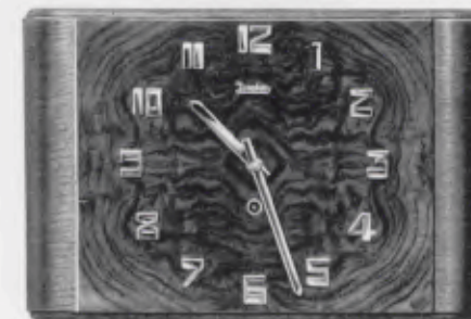
22x34 cm = 8 5 / 8 x 13 3 / 8 inches

Chromium plated figures and hands Chiffres et aiguilles chromés Cifras y agujas cromadas