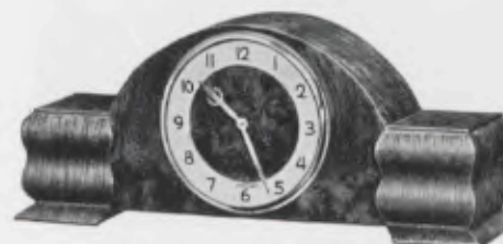
12×30 cm = 4 3 / 4 ×11 3 / 4 inches

Junghans Synchronous-Movement for controlled alternating-current of 90-260 volts Mouvement Synchron Junghans pour courant alternatif contrôlé de 90 à 260 volts Máquina Sincron Junghans para corriente alternativa controlada de 90 a 260 voltios