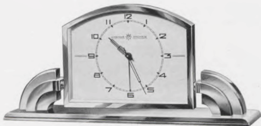
9,5×20,5 cm = 3 3 / 4 ×8 inches