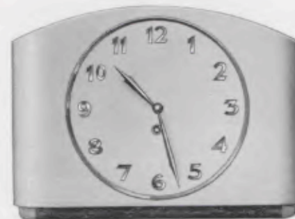
23x32,5 cm = 9x12 1/4 inches