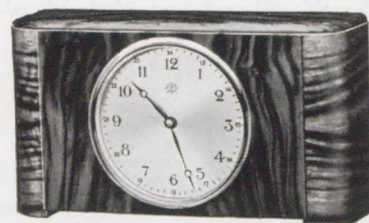
12 x 22 cm = 4 3/4 x 8 3/4 inches

Silberzahlenreif – Silvered figure-circle Cercle à chiffres argenté – Cerco de cifras plateado