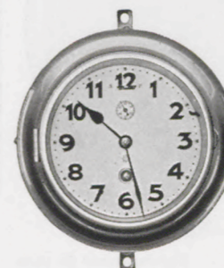
19,5 cm = 7 1/2 inches