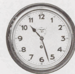
20 cm ø

Nr. 460/21 Fabrikat Junghans, 8-Tag-Ankerwerk, 11 St. Holzgehäuse mahagonifarbig, Chromreif mit Schutzglas, Silberblatt Serie 92011 RM 34.—