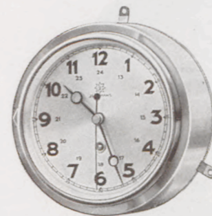
Schiffsuhr 20 cm ø

Nr. 460/15 Fabr. Junghans, 8-Tag-Ankerwerk, 11 St., Metallgehäuse verchromt, mit Schutzglas Silberblatt Serie 93811 RM 48.—