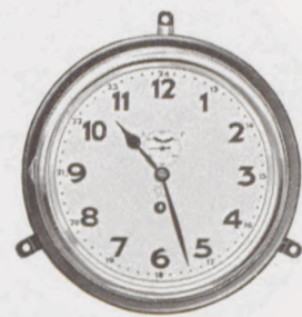
20 cm ø

Für einschlägige Geschäfte ist die Lagerhaltung in Schiffsuhren unerlässlich