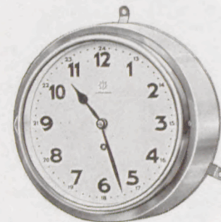
20 cm ø

Nr. 460/20 Fabrikat Junghans, 8-Tag-Ankerwerk Holzgehäuse mahagonifarbig, Chromreif mit Schutzglas, Silberblatt Serie 9061 RM 17.—