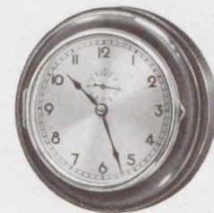
14,5 cm ø

Nr. 460/9 Fabrikat Junghans, 1-Tag-Gehwerk Metallgehäuse rotbraun, Nickelreif mit Schutzglas, Lackblatt, S. 9761 RM 11.— Nr. 460/10 8-Tag-Ankerwerk, ohne Sekunde Serie 9911 RM 14.—