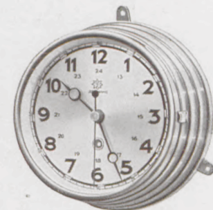
Schiffsuhr 20 cm ø

Nr. 460/12 Fabrikat Junghans, 1-Tag-Ankerwerk, Geh. Nußbaum, Messingreif mit Schutzglas Lackblatt Serie 92136 RM 18.50 Nr. 460/13 8-Tag-Ankerwerk Serie 92711 RM 28.—