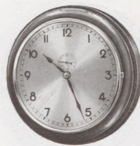
18 cm ø

Nr. 460/19 Fabrikat Junghans, 8-Tag-Ankerwerk Holzgehäuse mahagonifarbig, Chromreif mit Schutzglas, Silberblatt Serie 9911 RM 14.—