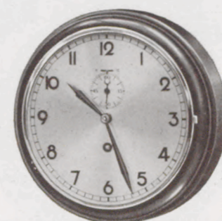
21 cm ø

Nr. 460/14 Fabrikat Junghans, 8-Tag-Ankerwerk Metallgehäuse verchromt, mit Schutzglas Silberblatt Serie 92211 RM 19.—