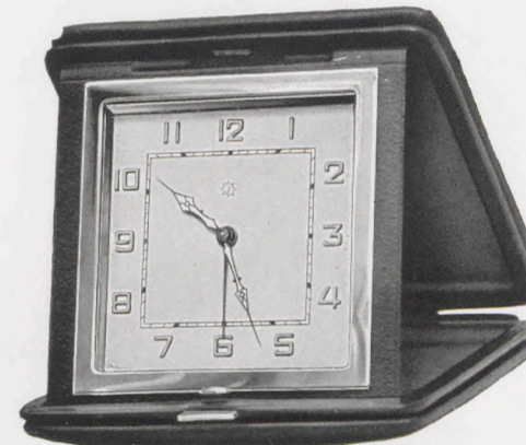
10,5 × 10,5 cm = 4 1 / 8 × 4 1 / 8 inches

Máquina completa J 62 (sin estuche) para abertura de estuche de 61 × 61 mm