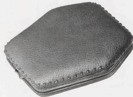
10,5 × 10,5 cm = 4 1 / 8 × 4 1 / 8 inches

101/102 RZ Saffian-Schafleder, rotbraun — Brown sheep's skin, morocco grained — Mouton grain maroquin, brun-rouge — Badana tafilete, moreno