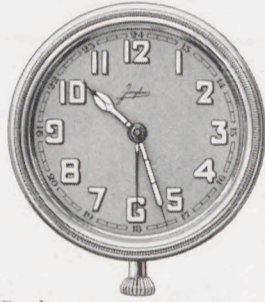
Durchmesser — Diameter — Diamètre Diámetro 6,8 cm = 2 3 / 4 inches

Travelling watches — Montres de voyage — Relojes para viaje