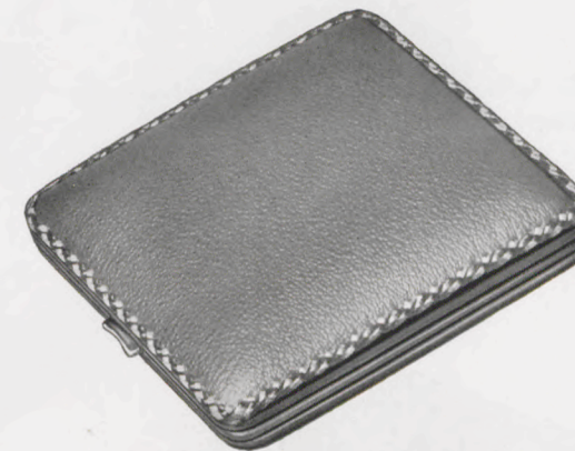
10,5 × 10,5 cm = 4 1 / 8 × 4 1 / 8 inches

101/110 RZ Saffian-Schafleder, braun Brown sheep's skin, morocco grained Mouton grain maroquin, brun Badana tafilete, moreno