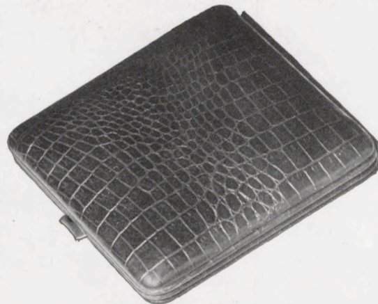
10,5 × 10,5 cm = 4 1 / 8 × 4 1 / 8 inches

101/107 RZ Saffian-Schafleder, rotbraun — Brown sheep's skin, morocco grained — Mouton grain maroquin, brun-rouge — Badana tafilete, moreno