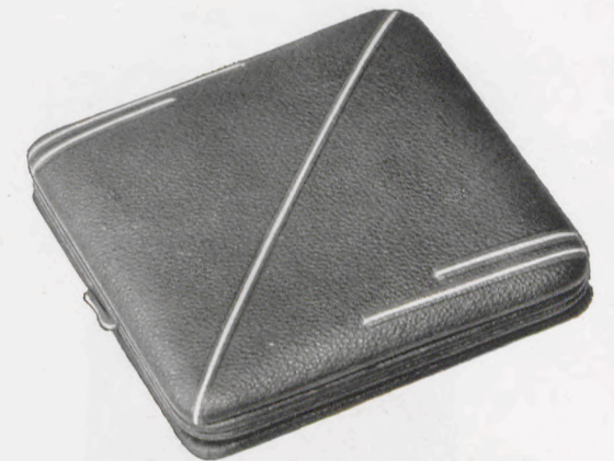
10,5 × 10,5 cm = 4 1 / 8 × 4 1 / 8 inches

101/111 RZ Saffian-Schafleder, braun Brown sheep's skin, morocco grained Mouton grain maroquin, brun Badana tafilete, moreno