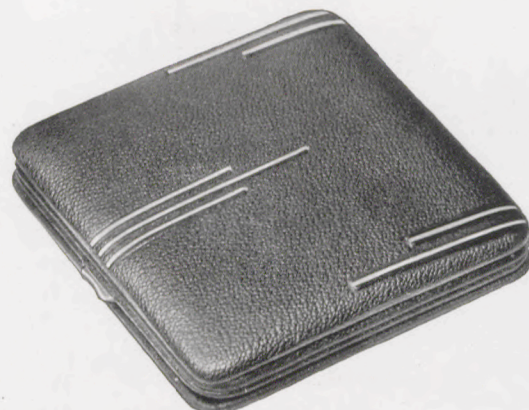
10,5 × 10,5 cm = 4 1 / 8 × 4 1 / 8 inches

101/106 RZ Krokodilimitation, dunkelbraun — Brown crocodile, grained — Crocodile grain, brun — Piel de cocodrilo imitación, moreno