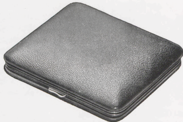
10,5 × 10,5 cm = 4 1 / 8 × 4 1 / 8 inches

Máquina completa J 62 (sin estuche) para abertura de estuche de 63 1 / 2 mm