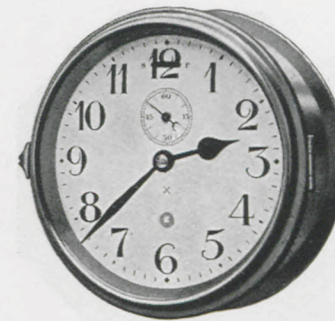
Gehäuse-Durchmesser 20 cm Zifferblatt- " 16 "

15 G 8 Tag-Anker-Gehwerk, massives Messinggehäuse, poliert oder vernickelt. Weißes Email-Zifferblatt. Gewöhnliches Glas