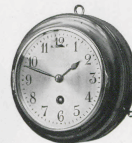
Gehäuse-Durchmesser 16 cm Zifferblatt- " 11,5 "

19 P 8 Tag-Anker-Gehwerk, Eisengehäuse braun bronziert, massive Messinglünette oder massives Messinggehäuse, Messinglünette poliert oder vernickelt. Weißes Email-Zifferblatt. Facetteglas