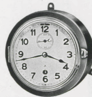
Gehäuse-Durchmesser 18,5 cm Zifferblatt- " 13,5 "

15 G 8 Tag-Anker-Gehwerk, massives Messinggehäuse, poliert oder vernickelt. Weißes Email-Zifferblatt. Gewöhnliches Glas