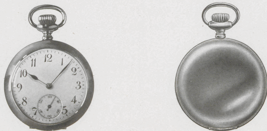
Natürliche Größe - Natural size - Grandeur naturelle

Werk No. J 32 mit 7 Steinen, Kompensations-Breguetspirale, Anker mit sichtbaren Steinen, doppelte Sicherheitsrolle, Platinen vergoldet