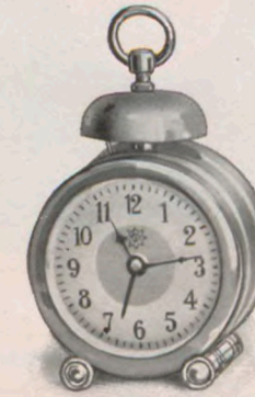
Höhe — Hauteur 9 cm

Metallgehäuse, schwarz , sehr haltbar, oxydiert. Silberzifferblatt. Boîte métal, oxydé (très solide). Cadran argent.