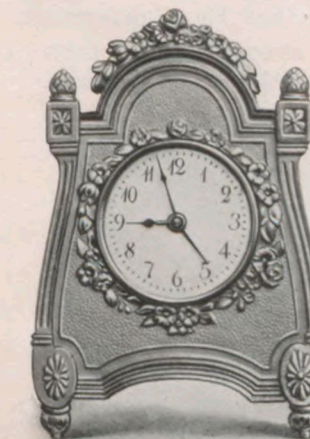
Höhe — Hauteur 11 cm

Kunstgußfassade, vergoldet . Emailzifferblatt. Façade fonte artistique, doré . Cadran émail.