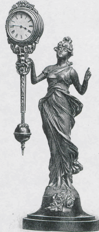
Altezza 35 cm. Statua artistica di metallo patiné, oro o argento Zoccolo di legno Orologio di metallo dorato mat.