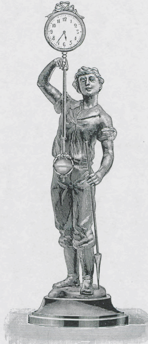
Altezza 41 cm. Statua di metallo patiné bruno Zoccolo di legno noce a cera.