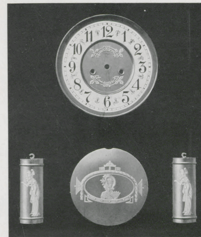
Matt vergoldet mit Hochrelief-Auflagen.