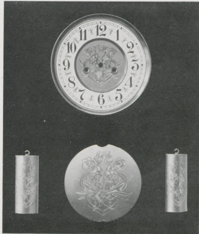
Fein graviert und vergoldet.