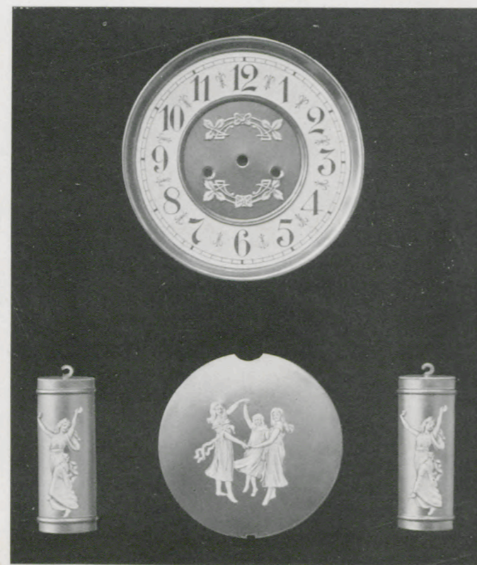
Matt vergoldet mit Hochrelief-Auflagen.