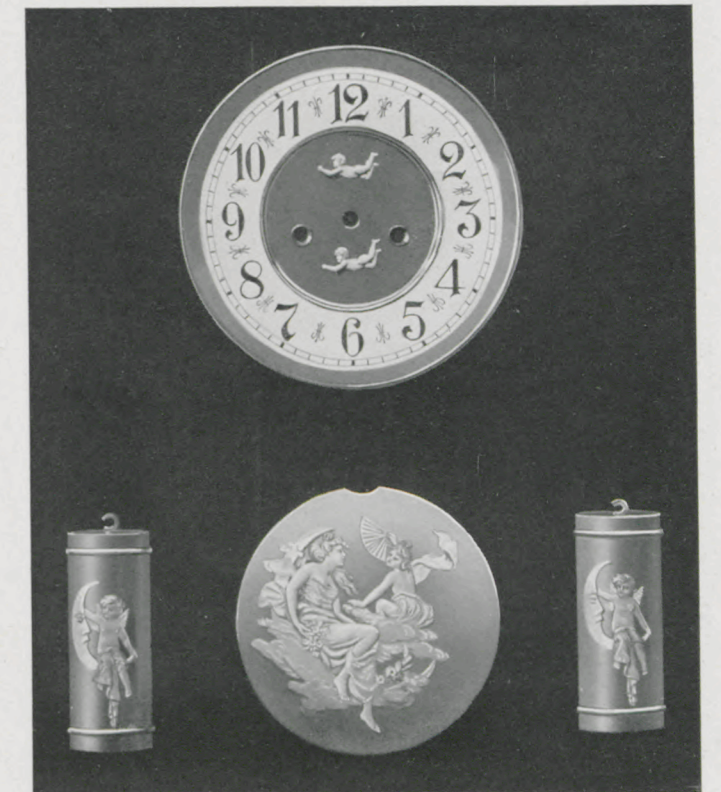
Matt vergoldet mit Hochrelief-Auflagen.