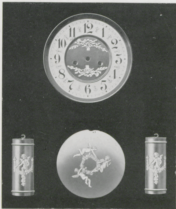
Matt vergoldet mit Hochrelief-Auflagen.