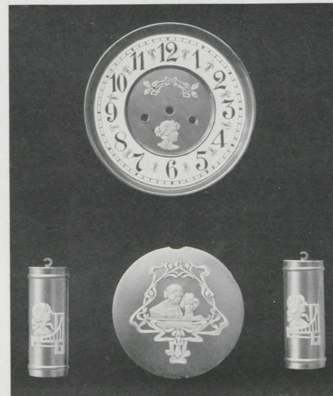
Matt vergoldet mit Hochrelief-Auflagen.