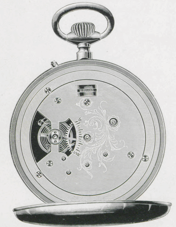
Innenansicht. — Interior view. — Vista de la máquina.