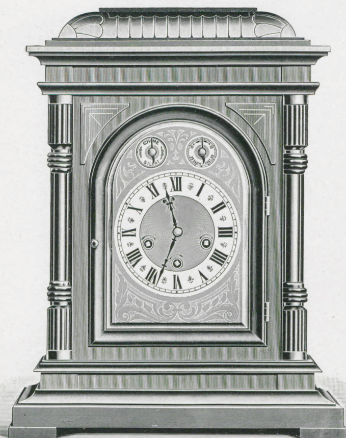
Höhe 42 cm. Hauteur 42 cm.

Chêne ou imitation acajou poli. Cadran métal gravé couleur or avec cercle argent. Glace à biseau.