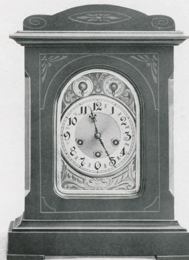
Höhe 43 cm. Hauteur 43 cm.

Acajou véritable, poli avec marqueterie véritable. Cadran métal gravé couleur or avec cercle argent. Glace à biseau.