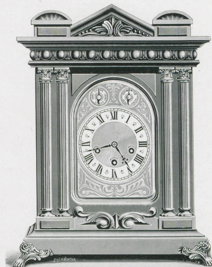
Höhe 46 cm. Hauteur 46 cm.

Chêne poli, garniture fonte artistique couleur or. Cadran métal gravé couleur or avec cercle argent. Glace à biseau.