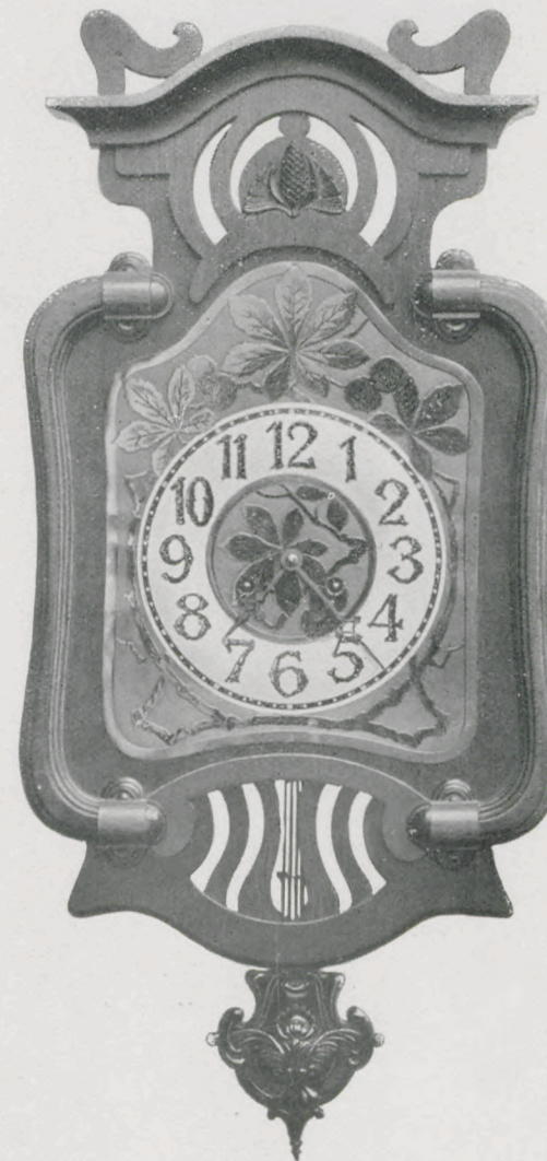
Länge 69 cm. — Longueur 69 cm.

Chêne. Cadran en métal, gravée à l'eau forte.