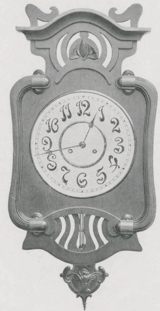
Länge 69 cm. — Longueur 69 cm.

Chêne. Cadran en métal, couleur d'argent.