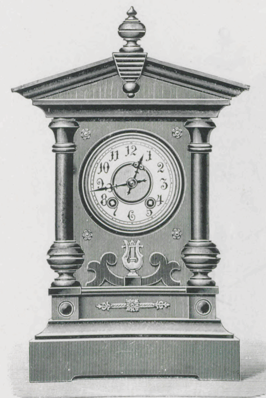
Höhe 42 cm. — Hauteur 42 cm.

Noyer mat et parties polies avec garniture en métal, couleur d'or. Cadran en celluloid. La mesure de la musique est facile à régler.