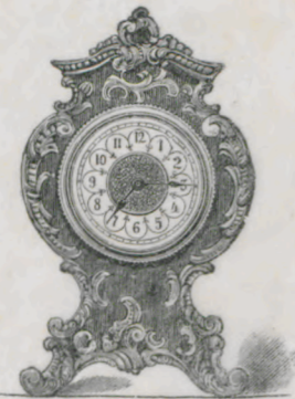
Höhe 14,5 cm.

Nussbaum poliert mit Goldguss-Garnitur; Celluloid-Zifferblatt; facettiertes oder bombiertes Glas.