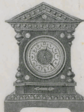
Höhe 14,5 cm.

№ 3198. 1 Tag Gehwerk. Kr. 6.10. » 3656. 1 Tag Gehwerk Wecker. » 8.70.