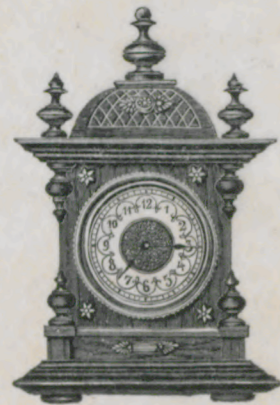
Höhe 16 cm.

Natur-Nussbaum mit Glanzteilen und goldfarbiger Metall-Garnitur; facettiertes oder bombiertes Glas. Celluloid-Zifferblatt.