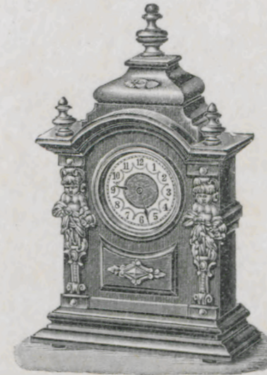
Höhe 20,5 cm.

Natur-Nussbaum mit Glanzteilen und cuivre poli-Garnitur; Celluloid-Zifferblatt, facettiertes oder bombiertes Glas.