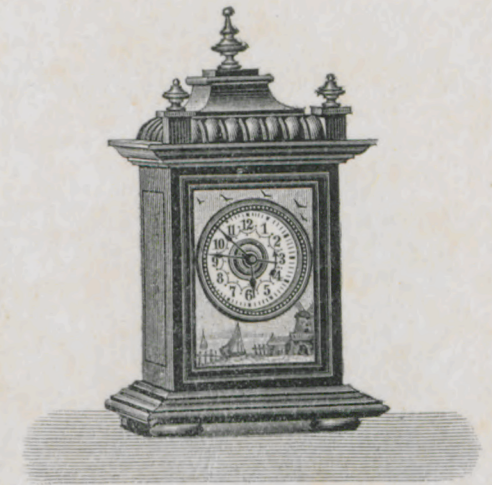
Höhe 16 cm.

Holz-Gehäuse, schwarz oder Mahagony. Goldgarnitur, facettiertes Glas. Porzellanfüllung mit Delftmalerei. Celluloidblatt.