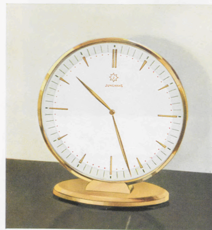
14 x 13 cm