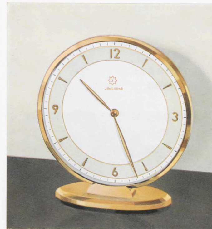
14 x 13 cm