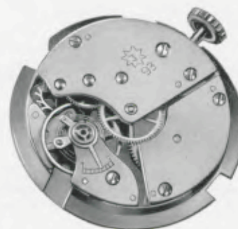
J 93 = 25 mm

Illustration 1 1/2 original size Illustration, agrandie 1 1/2 fois