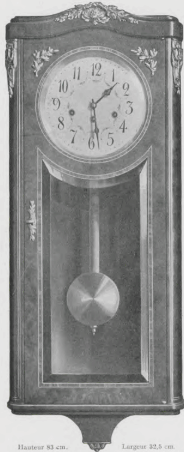
Hauteur 83 cm. Largeur 32,5 cm. Cadran de 18 cm. émail ivoire et aiguilles de style.

Wm. Ruster Loupe de tuya, d'orme ou d'amboine, ou citronnier, filets bois de rose, ornements bronze doré Fermeture à clé