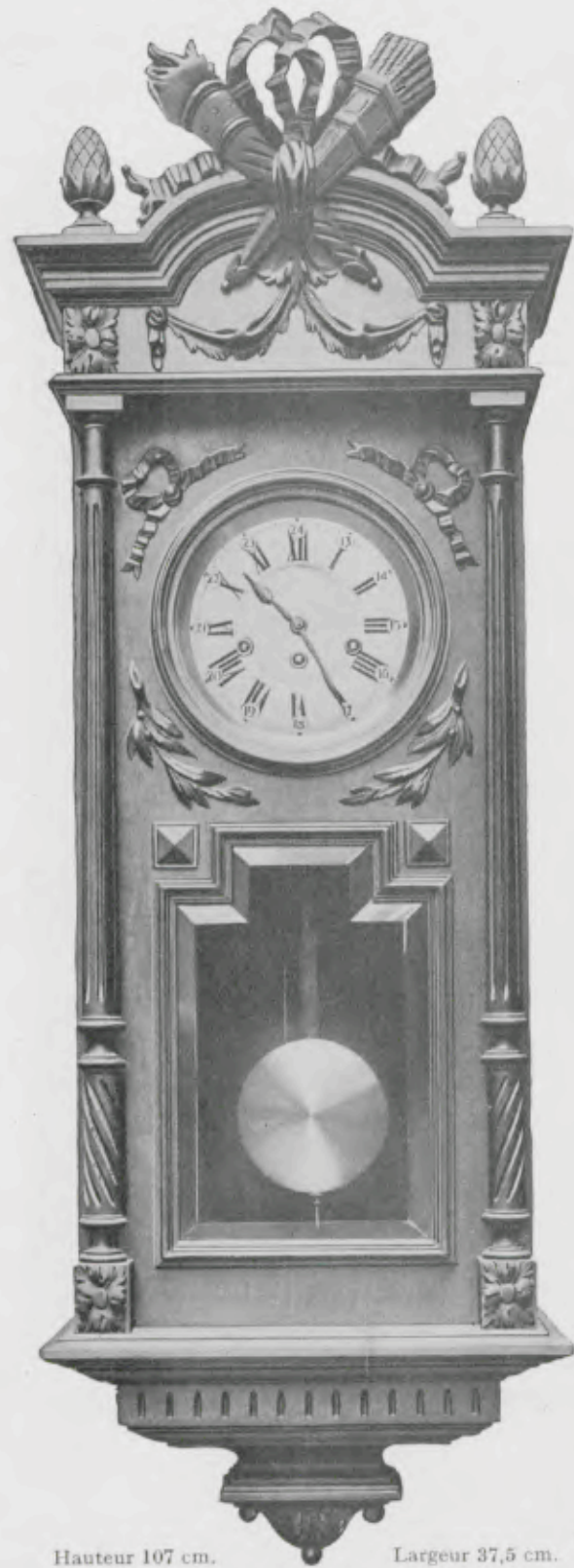
Hauteur 107 cm. Largeur 37,5 cm. Cadran argenté ou émail ivoire de 18 cm.