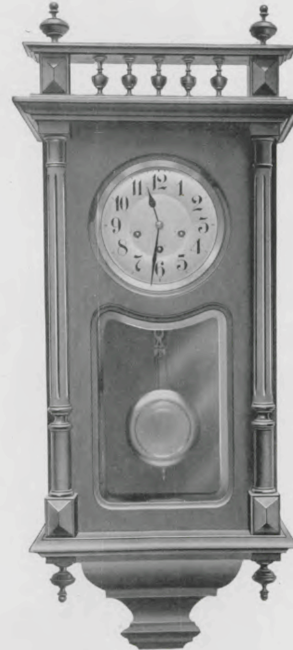
Hauteur 92 cm. Largeur 40 cm.