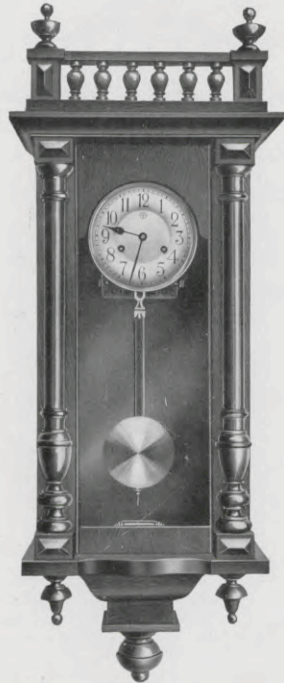
Hauteur 90,5 cm. Largeur 34,5 cm.

Cadran argenté de 15 cm., balancier tige bois, lentille cuivre uni, verre simple.